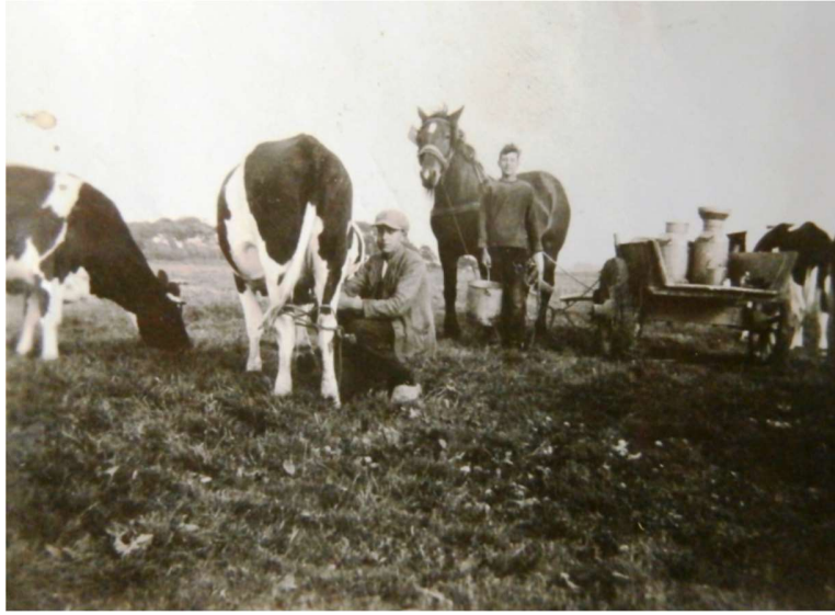
Links Sikke Norbruis, rechts Sijbe Norbruis.