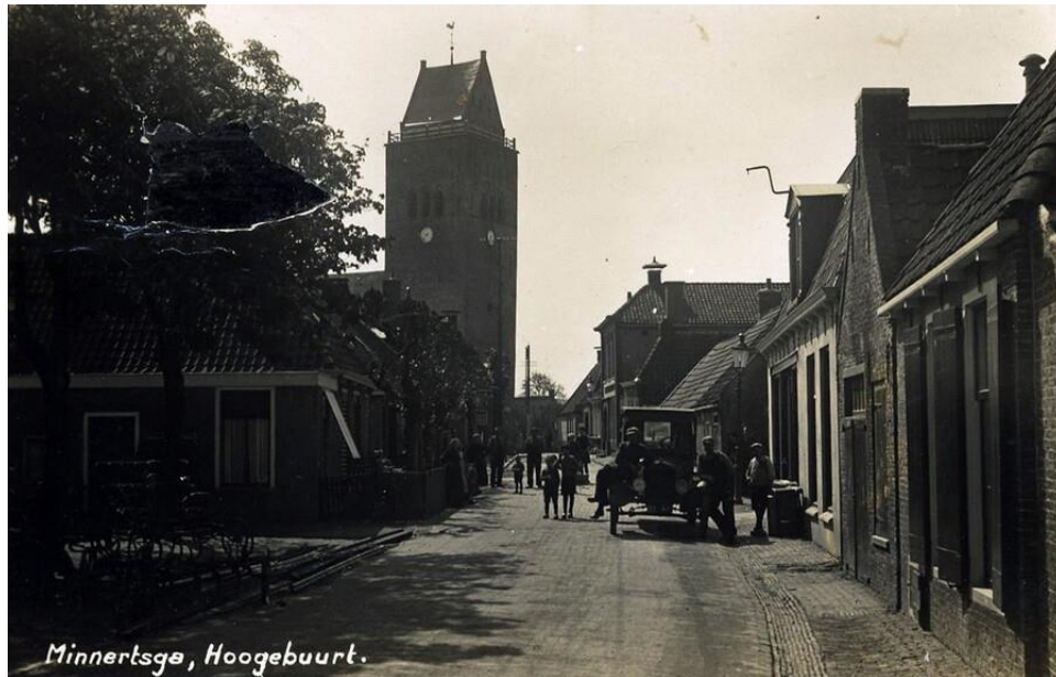
Rechts witte pand nummer 19, dan 21 en 23