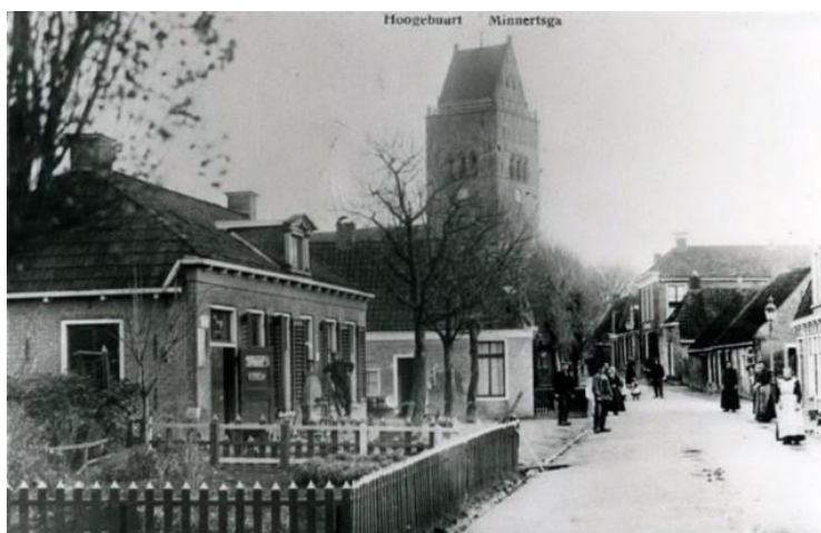
Links de nummers 24 en 16

Het gezin van Foppe Post (later 5p) komt direct daarna in deze woning vanaf de Hearewei 14. Begin 1984 wonen ze er nog.