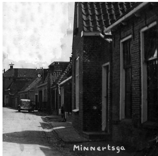
Rechts o.a. nummers 25, 27, 29

Het huis wordt afgebroken in november 1968.