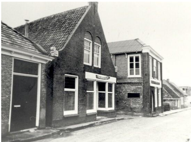
Nummers 1 (deels), 3 en 5