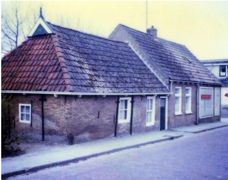
Nummers 13, (15) en 17a