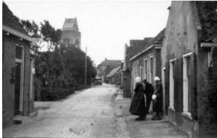
Noordkant Hege Buorren

Wouter de Roos (2p) komt in september 1966 van Hege Buorren 5. Met de grenswijziging per januari 1984 woont Wouter hier nog met zijn vrouw Aaltsje.