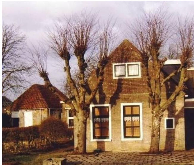
Westzijde nummer 17

Hierna wordt het een recreatiewoning met als eigenaar J.W. de Rooter van de Rothaanstraat 9 in Eindhoven.