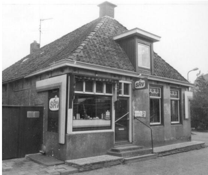
Hege Buorren 8

Op 11 mei 1965 wordt het gezin van Sjoerd Wiersma en zijn vrouw Jantsje (3p) ingeschreven vanaf de Ferniawei 11. Ze verhuizen 1 april 1977 naar de P.B. Winsemiusstrjitte 2, waarna het gezin van hun zoon Jetze Wiersma en vrouw Djoke (5p) zich hier vestigt op 1 april 1977 vanuit de Collot d' Escurystrjitte 5. In 1984 (grenswijziging het Bildt) wonen ze hier nog.