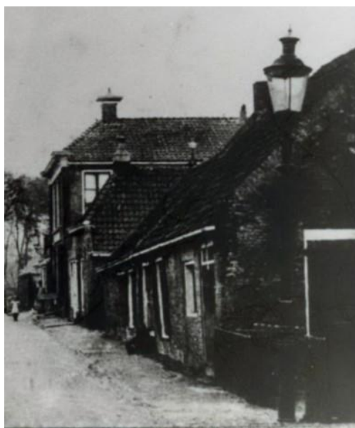
Vlnr: nummers 5, 7, 13 en 15

Bewoond door Jelle Terpstra en diens vrouw Klaaske van Keimpena als laatste bewoners. Per juli 1954 verhuisden ze naar Minnertsga 132 (Hege Buorren 42) en werd de woning bij raadsbesluit van 7 juni 1955 onbewoonbaar verklaard en eigendom van de gemeente Barradeel. Afgebroken in juli 1964.