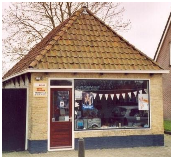
Nummer 23, daarachter 21.

Hierna komt het in gebruik bij Reinder K. Wiersma, die het als etalage gebruikt. Hij is smid op de Hege Buorren 24. Foppe Post neemt het later over.