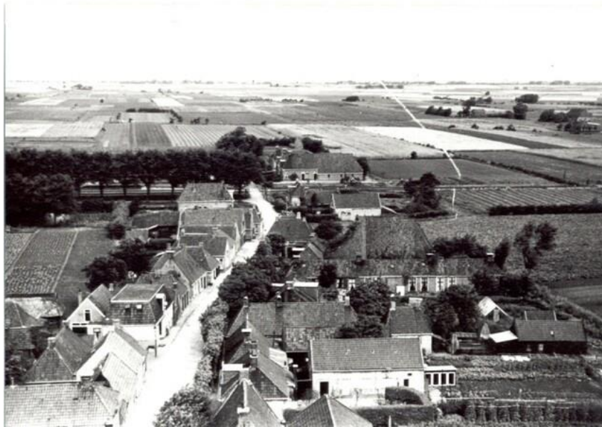
Luchtfoto Hege Buorren, rechtsmidden 't Straatsie