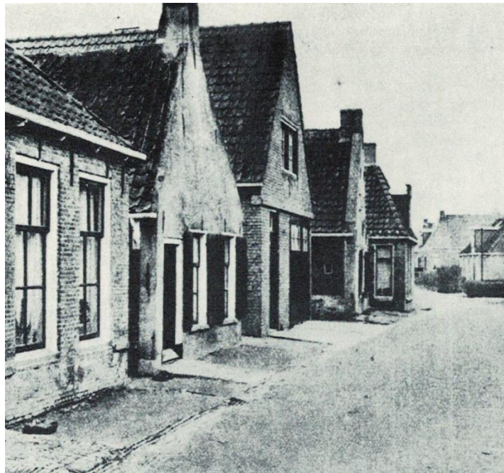
Noord-westzijde Hege Buorren, o.a. nrs 31 – 39