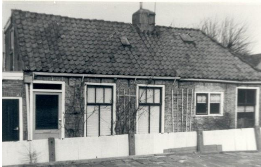
Nummers 11 (l) en 9