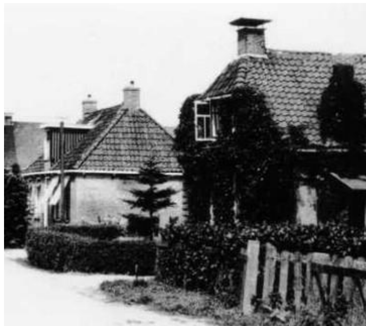
Nummer 52 en 54/56

Klaas Vis (en Griet Siegersma) volgt hen op (later 5p) in december 1969. Hij kwam van Sixma van Andlawei 1 (ouderlijk huis?). Als Minnertsga op 1 januari 1984 bij het Bildt komt wonen ze er nog.