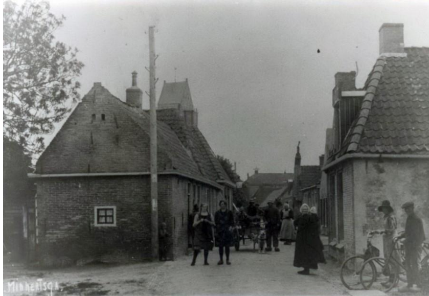
Noordkant Hege Buorren