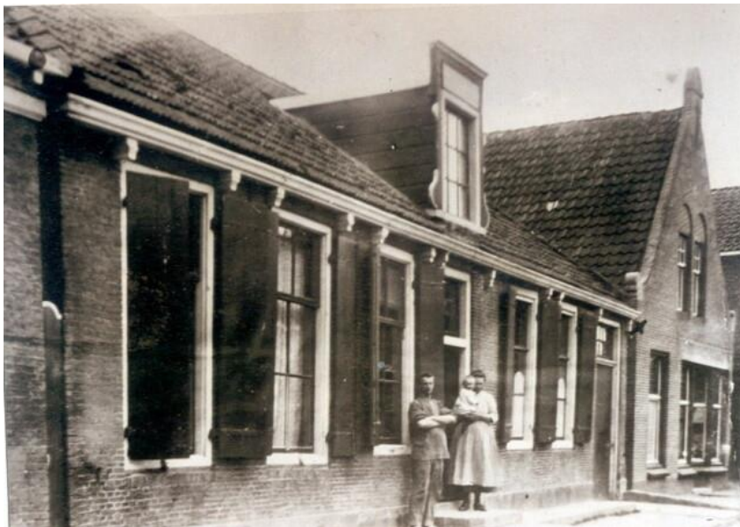
Hege Buorren 1 en 3