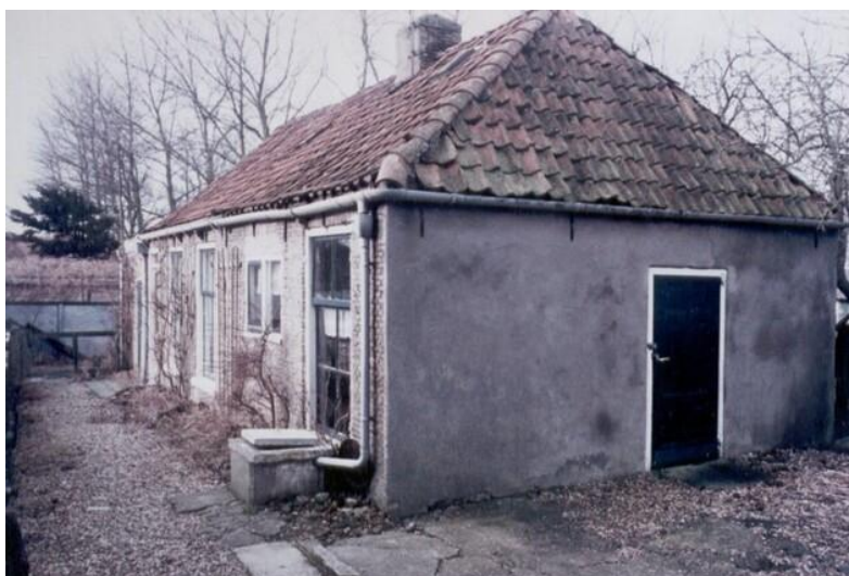
Nummers 9 en daarachter 11