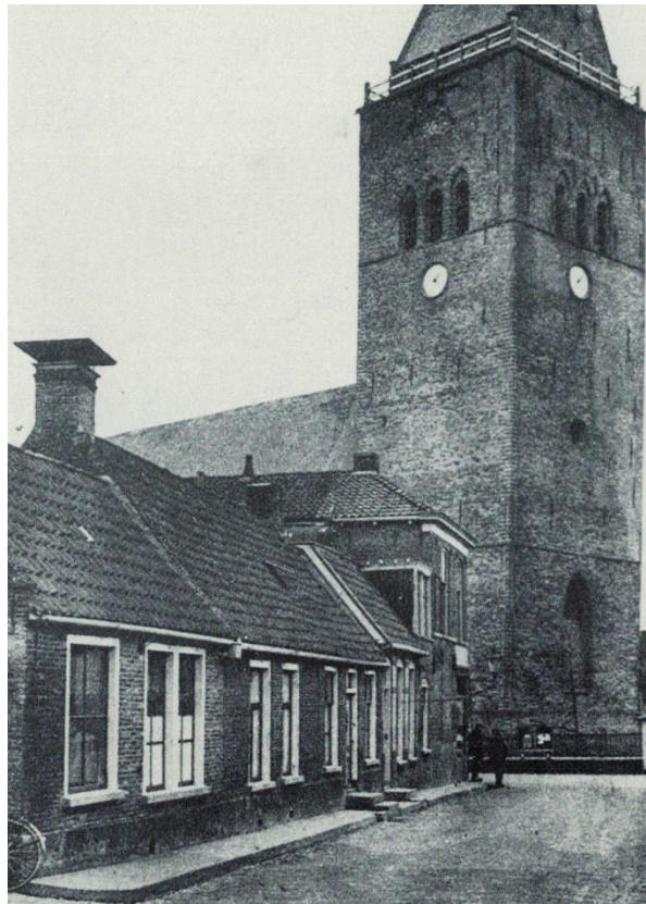
Hege Buorren 2 en 4

Niet veel later (6 oktober 1966) wordt het pand afgebroken.