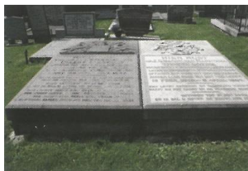
Minnertsga, grafkelder Collot d'Escury (met detail) & grafkelder van Harinxma thoe Slooten-Collot d'Escury